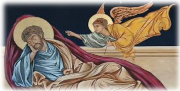
Cuarto Domingo de Adviento 21 de Diciembre 2025