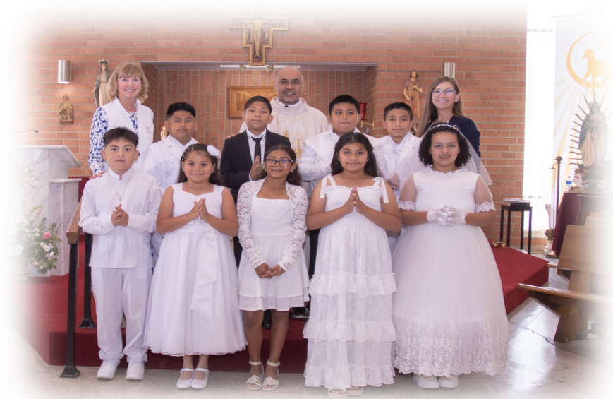
Celebracion de Primera Comunion en Santa Clara